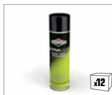
992420 UltraCare™ Hochleistungsentfetter 200ml