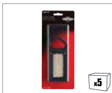
992357 Luftfilter und Vorfilter