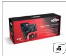
992430* Abdeckhaube für Schneefräsen / Motorhacken