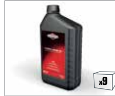
100008E 4-Takt Motorenöl 2,0L