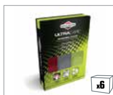
992429* UltraCare™ Mikrofaser-tücher zum Schrubben, Reinigen und Polieren