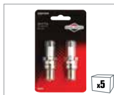
992362 2 x Zündkerze BS-OHV