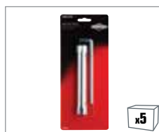
992356 Zündkerzenschlüssel – 19-21mm