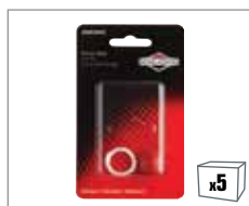
992363 Primer – 450 Series™, 500 Series™, 550 Series™