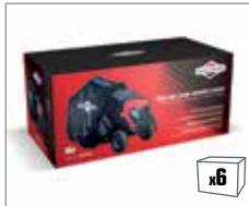
992425 Abdeckhaube für Aufsitzmäher