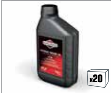
100005E 4-Takt Motorenöl 0,6L