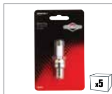
992361 1 x Zündkerze BS-OHV