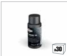
992413 Synthetisches 2-Takt Motorenöl 100ml

Vollsynthetisches Öl für die Verwendung in 2-Takt Motoren.