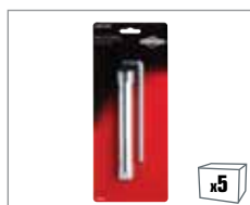
992355 Zündkerzenschlüssel – 16-19mm