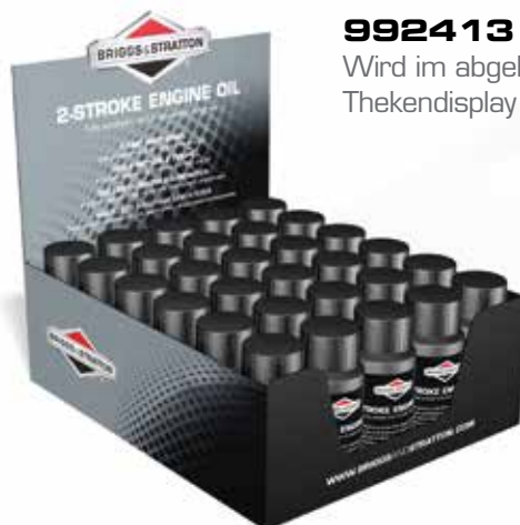
992413 Wird im abgebildeten Thekendisplay geliefert