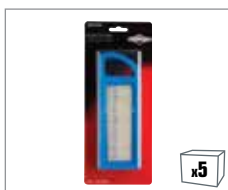
992358 Luftfilter und Vorfilter