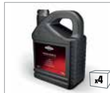
100009E 4-Takt Motorenöl 5,0L