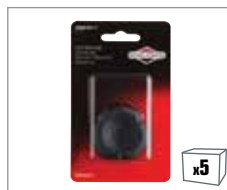
992371 Tankdeckel – 600 Series™