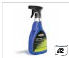
992416 UltraCare™ Bio-Reinigungsspray 0,5L