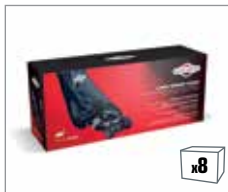
992424 Abdeckhaube für Rasenmäher