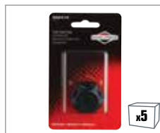
992372 Tankdeckel – 450 Series™, 500 Series™, 550 Series™