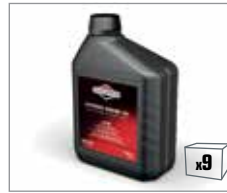
100006E 4-Takt Motorenöl 1,4L