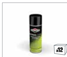
992419 UltraCare™ Vergaserreiniger 200ml