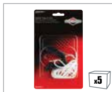
992367 Starterseil und Handgriff – 600 Series™