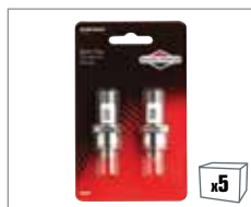
992360 2 x Zündkerze BS-SV