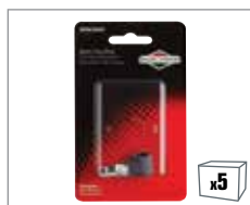
992365 Zündkerzenstecker – alle Motoren