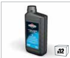
100007W 4-Takt Winter Motorenöl 1,0L

Speziell entwickelt für die Verwendung in 4-Takt Motoren bei niedrigen Temperaturen bis zu -30°C.