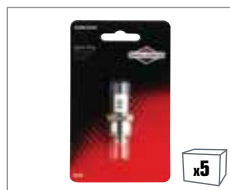
992359 1 x Zündkerze BS-SV