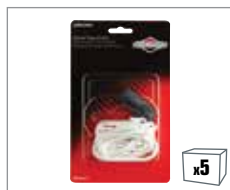
992366 Starterseil und Handgriff – 600 Series™