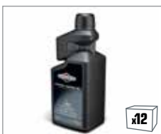
992414 Synthetisches 2-Takt Motorenöl 1,0L