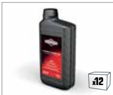
100007E 4-Takt Motorenöl 1,0L