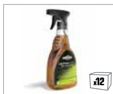
992417 UltraCare™ Anti-Schmutz-Protector 0,5L