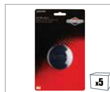
992353 Ölfilter kurze Ausführung