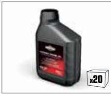
100004E 4-Takt Motorenöl 0,5L

Speziell entwickelt für die Verwendung in 4-Takt Motoren unter normalen Bedingungen.