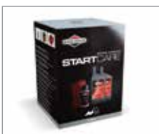
992210 Start Care Kit

Start Care Kit für die Inbetriebnahme und den Ölwechsel nach 5h für Motoren mit 0,6L Ölfassungsvermögen.