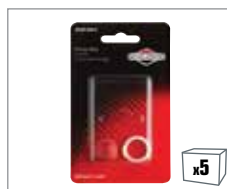
992364 Primer – 600 Series™, Intek™