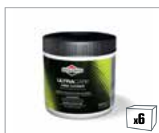
992418 UltraCare™ Handreiniger 600ml