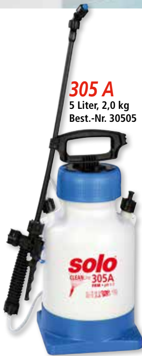
305 A 5 Liter, 2,0 kg Best.-Nr. 30505