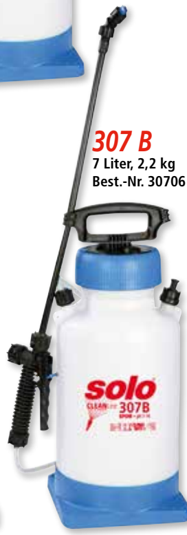
307 B 7 Liter, 2,2 kg Best.-Nr. 30706

Reinigung und Desinfektion bei größeren Flächen oder auch einmal längeren Wegen meistern die schultertragbaren SOLO Druckspritzen der CLEANLine-Serie. Sie sind platzsparend zu lagern und bei Bedarf immer sofort betriebsbereit. Je nach Größe der zu behandelnden Fläche stehen mit 5 bzw. 7 Litern zwei verschiedene Behältervolumen zur Verfügung. Die Behälter gehören zu den robustesten auf dem Markt. Auch Stürze von Ladeflächen und ähnliche Bewährungsproben machen den Profi-Druckspritzen nichts aus. Der transparente Behälter ist nicht nur extrem robust sondern auch gegen UV-Strahlen beständig und auf eine lange Lebensdauer ausgelegt. Für ermüdungsfreies Arbeiten sorgt die extra-große Kolbenpumpe, die den nötigen Arbeitsdruck schon mit nur wenigen Pumphyben erzeugt. Das Auslöseventil liegt gut in der Hand und sorgt in Verbindung mit dem stabilen gewebeschlauch und der 50cm langen Lanze aus speziellem non-corrosive Material für eine große Reichweite. Öffnen lassen sich die Spritzen ganz einfach durch Drehen des Handgriffs, an dem sich auch die Lanze nach der Arbeit einklipsen lässt. Die große Füllöffnung erleichtert Befüllen wie auch Entleeren und Reinigung der Spritzen. Zur Ausstattung gehören eine hochwertige, chemikalienresistente Flachstrahldüse und ein praktischer langer und breiter Tragegurt.