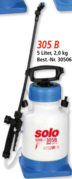
305 B 5 Liter, 2,0 kg Best.-Nr. 30506