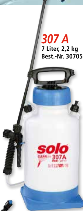
307 A 7 Liter, 2,2 kg Best.-Nr. 30705