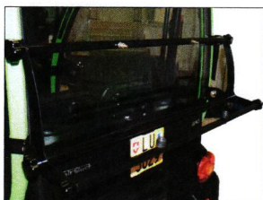
Gepäckträger hinten CHF 340.- BIR-5600904