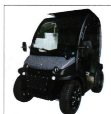
Black Edition Kit CHF 2'700.-