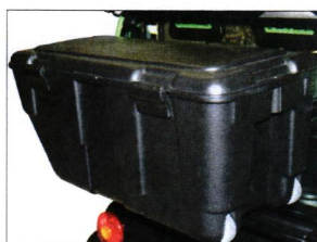
Gepäckbox mit Rollen CHF 200.- BIR-2600892